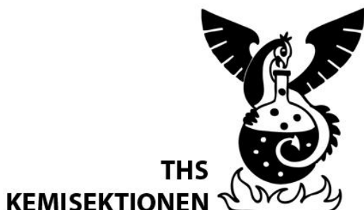
Kemisektionens logotyp - Original

Kemisektionens logotyp består av emblemet ("Kajan") med texten "THS Kemisektionen" i typsnittet Myriad Pro, högerjusterad till vänster om emblemet. Logotypen finns i en svartvit version samt en i färg.