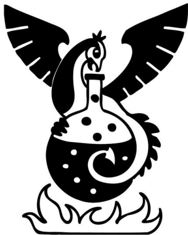
Kemisektionens emblem - Original

Kemisektionens emblem är Salamandern, som i vardagligt tal även kallas "kajan". Emblemet infördes i form av sektionsfanan vid THS hundraårsjubileum år 1927 och härstammar från manuskriptet "Veritas Hermetica Veritatem Quaerenti", daterat 1725. Salamandern registrerades som varumärke den 29 maj år 1970. Det finns flera olika versioner av emblemet men det som skall användas idag är originalet som syns nedan. Emblemet finns även i en färgversion. I enstaka fall, exempelvis i inbjudningar och diplom, får det akvarellmålade emblemet användas.