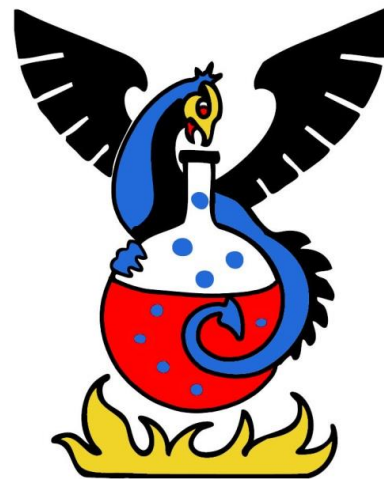
Kemisektionens emblem - Färg