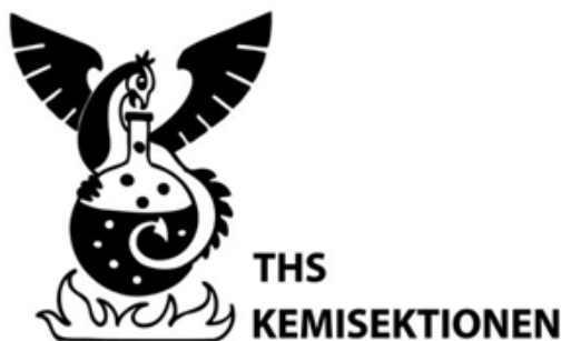
Kemisektionens logotyp - vänsterjusterad

På kuvert placeras logotypen fördelaktligen i det övre vänstra hörnet. Då passar det bäst med en vänsterjusterad logotyp, dvs. emblemet med texten "THS Kemisektionen" vänsterjusterad till höger om emblemet.