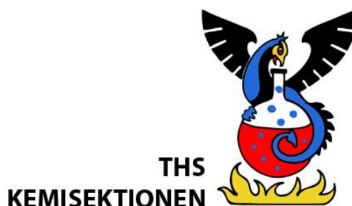
Kemisektionens logotyp - Färg